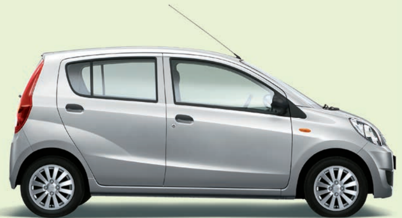
Arktissilber Perleffekt (S28)

» Egal, ob mit Perleffektlackierung* in Arktissilber und Schwarz oder in den Standardlackierungen Weiß und Rot – mit unseren attraktiven Farben sind Ihnen überall anerkennende Blicke und ein bewunderndes „Wow!“ sicher. Wählen Sie einfach Ihre Lieblingsfarbe für Ihren Cuore und machen Sie es sich bequem. Und seien Sie nicht irritiert, wenn Sie statt „Wow!“ auch mal ein „Guck mal da!“ oder „Will ich auch!“ hören.