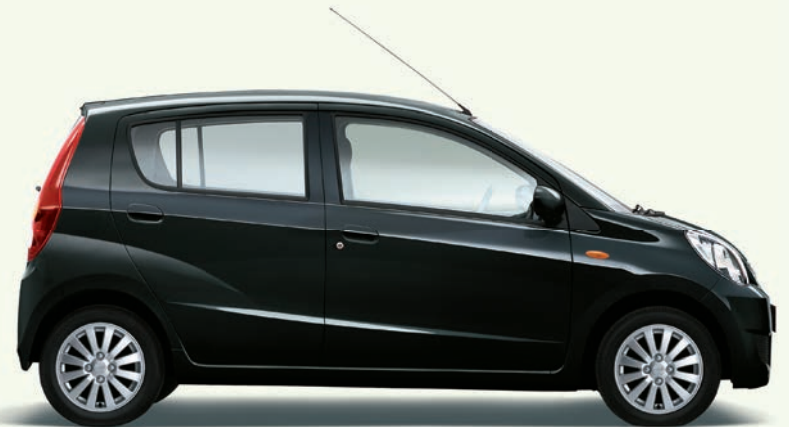
Schwarz Perleffekt (X07)